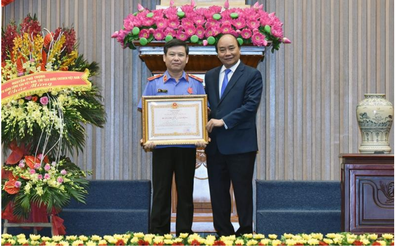
Thủ tướng Nguyễn Xuân Phúc trao tặng Huân chương Lao động hạng Nhất cho đồng chí Lê Minh Trí, Viện trưởng Kiểm sát nhân dân.

Để góp phần thực hiện thắng lợi những nhiệm vụ trên, Thủ tướng đề nghị ngành KSND cần thực hiện tốt chức năng Hiến định là thực hành quyền công tố và kiểm sát hoạt động tư pháp, trong đó tập trung một số nhiệm vụ trọng tâm: