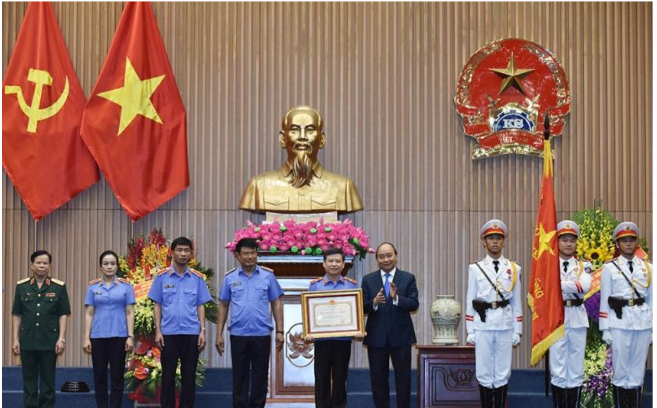
Thủ tướng Nguyễn Xuân Phúc trao tặng Huân chương Hồ Chí Minh cho Viện Kiểm sát nhân dân.

Tổng Bí thư, Chủ tịch nước Nguyễn Phú Trọng; Chủ tịch Quốc hội Nguyễn Thị Kim Ngân gửi lẵng hoa chúc mừng.