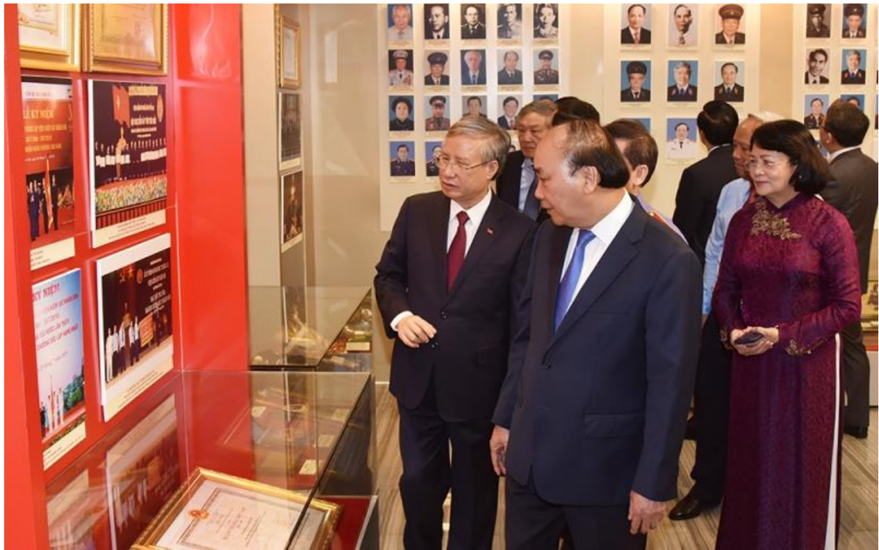
Thủ tướng Nguyễn Xuân Phúc và đại biểu thăm Phòng truyền thống về ngành Kiểm sát.