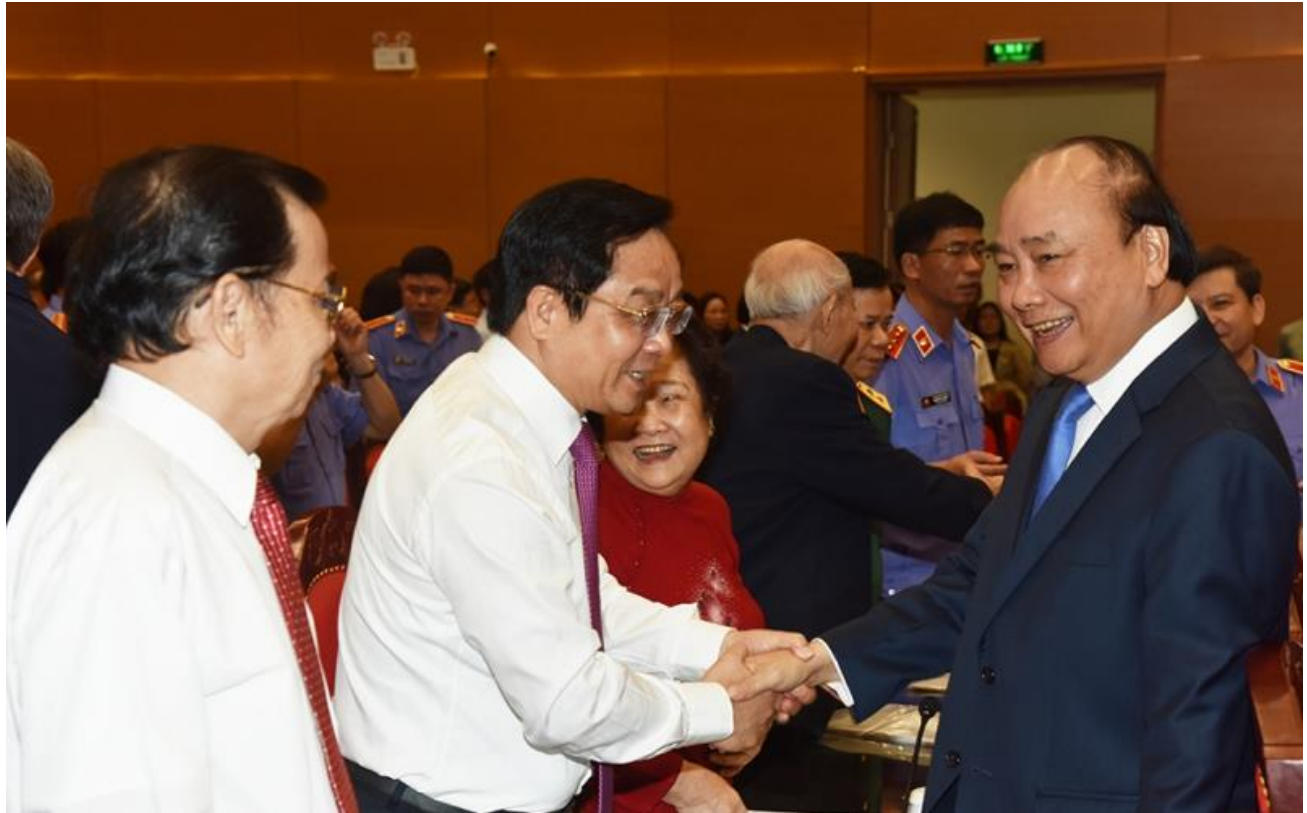
Thủ tướng Nguyễn Xuân Phúc và các đại biểu.